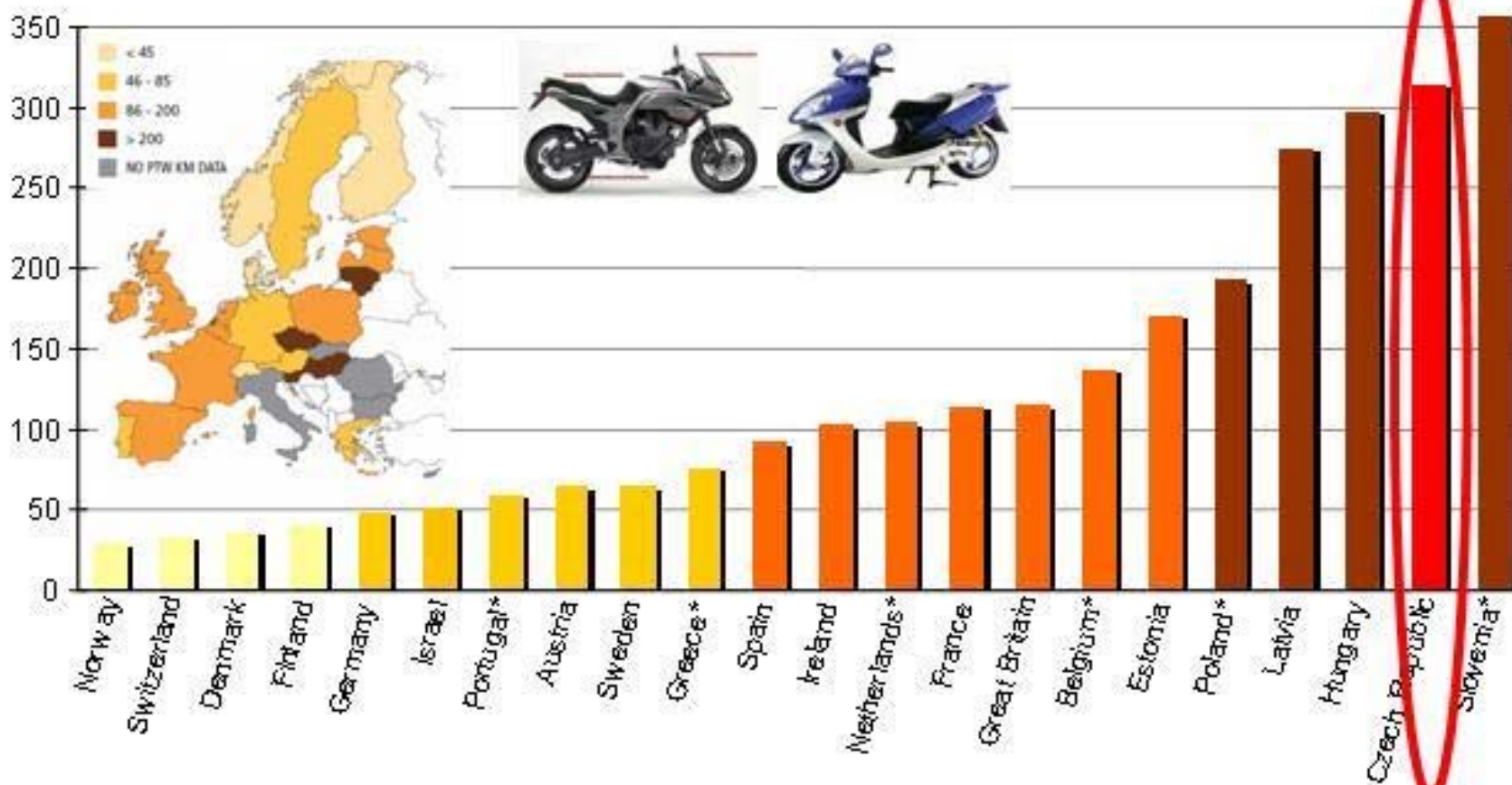
PTW rider deaths per billion km ridden in 2006